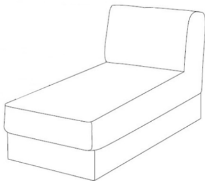
1 вариант кроя