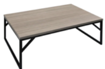
МАТИСС - М Стол журнальный (большой)