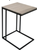
МАТИСС - М Стол приставной