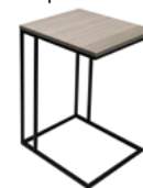
МАТИСС - М Стол приставной