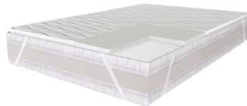
Soft Garant (Софт Гарант) Н- 4см

Кол-во: 80 90 120 140 160 180 200 длина 190 см: длина 200 см: